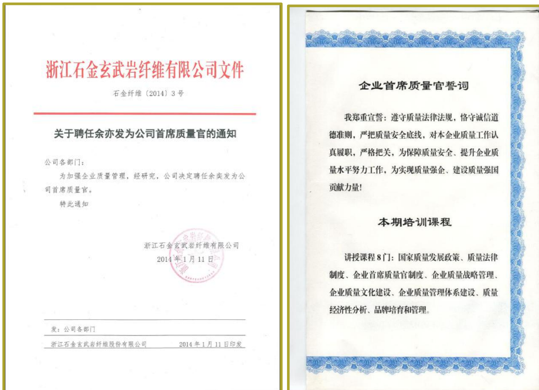
图 1 首席质量官证书及誓词